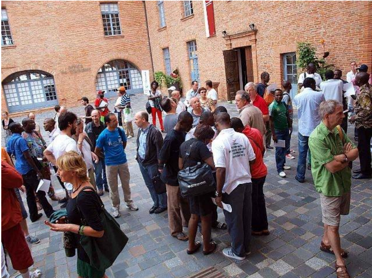
Les joueurs attendant le démarrage d'une ronde

74 joueurs provenant de 16 pays (France, Belgique, Suisse, Québec, Roumanie, Sénégal, Bénin, Gabon, Togo, RD Congo, Congo Brazza, Mali, Algérie, Angola, Burkina Fasso, Centrafrique), se sont retrouvés à Montauban pour des championnats du Monde de haute tenue. En effet, le championnat se déroulait cette année en une phase éliminatoire de 17 rondes (en 2 jours et demi) suivie d'une finale en deux manches gagnantes.